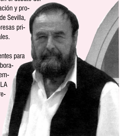
Harald Szeemann comisario de la BIACS 1.

Pero todos los apoyos ya conseguidos no son suficientes para financiar la Bienal y asegurar su éxito. Es necesaria la colaboración de todos los interesados en el desarrollo del arte contemporáneo y en mejorar la imagen de su ciudad. AMIGOS DE LA BIENAL ofrece la oportunidad de contribuir al éxito de la empresa, no sólo aportado una cantidad de dinero necesaria para